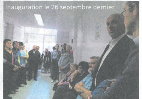
Inauguration le 26 septembre dernier